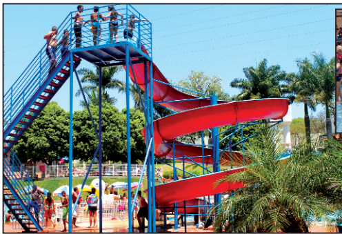
Clube do SINDEAC, na região metropolitana

Os associados também podem se hospedar no Hotel Diamantina, na Praia do Morro, Guarapari, Espírito Santo, com acomodações e serviços diferenciados.