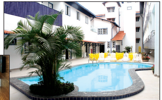
Hotel na Praia do Morro, Guarapari, Espírito Santo

E para você e sua família desfrutar destes e de outros benefícios, basta apenas ser sindicalizado